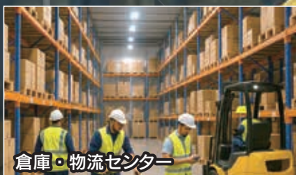
倉庫・物流センター