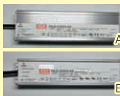
A Type 320W