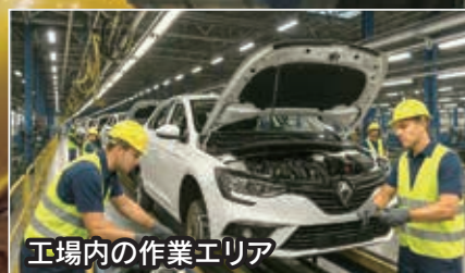
工場内の作業エリア